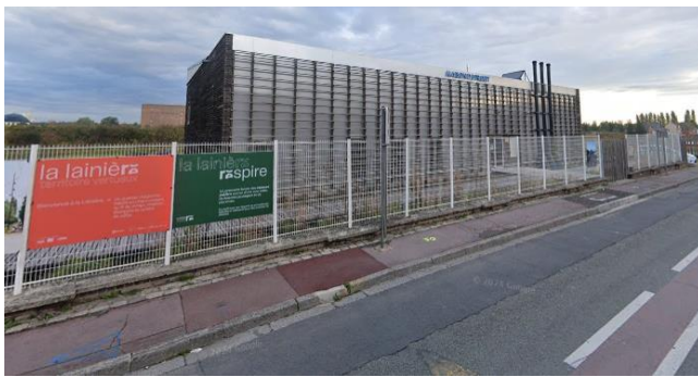
← La Maison du Projet